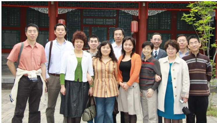
82级本科返校校友合影留念

5月3、4日，北京大学法学院部分校友重返母校，学院在新法学楼前组织了返校接待工作。本次返校校友中有年逾古稀的51级校友、经过精心组织参与返校活动的82级校友、毕业后常年旅居海外首次返校的87、88级校友，以及刚刚走过毕业10年的91、92级校友。在接待过程中，校友们与工作人员亲切交谈，回顾当年校园生活，询问学院发展现状，并对校友会工作及开展的校友活动提出宝贵建议。本次校友返校活动在充满温情和不舍的氛围下圆满结束。