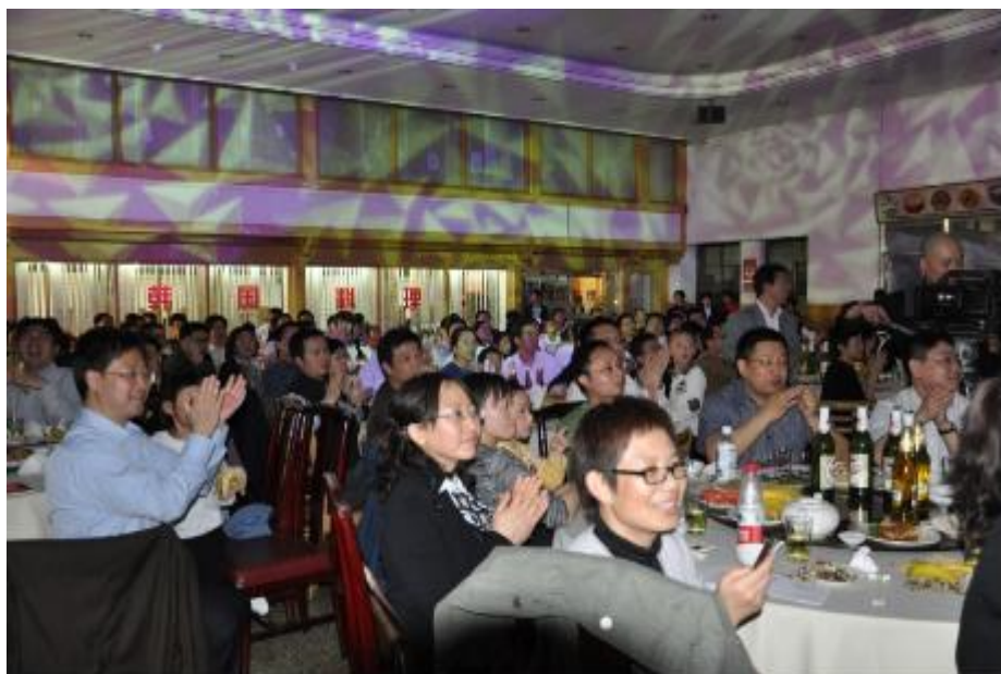
90级校友交流酒会现场

据了解,“北大1990级校友基金会”除先期向校友募集款项外,还在奠基仪式和酒会现场设立捐款点。广大校友纷纷慷慨解囊,为母校的发展贡献自己的一份力量。