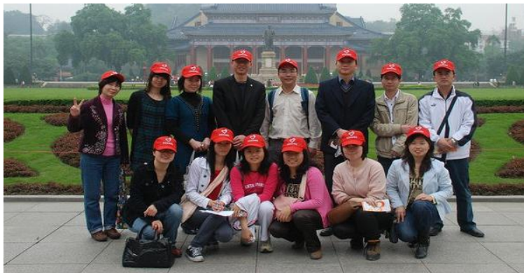
参与亚运会城市志愿者服务校友合影